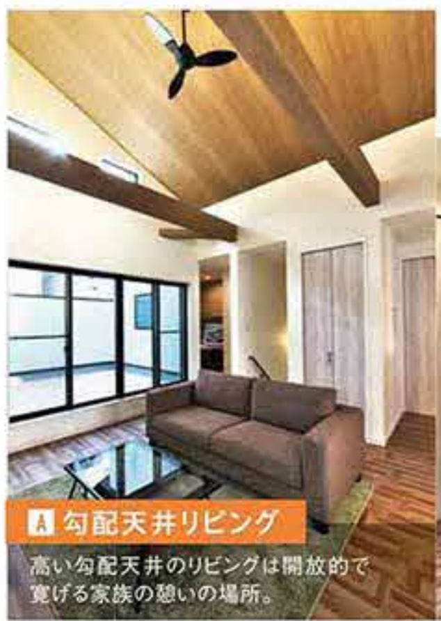
A 勾配天井リビング