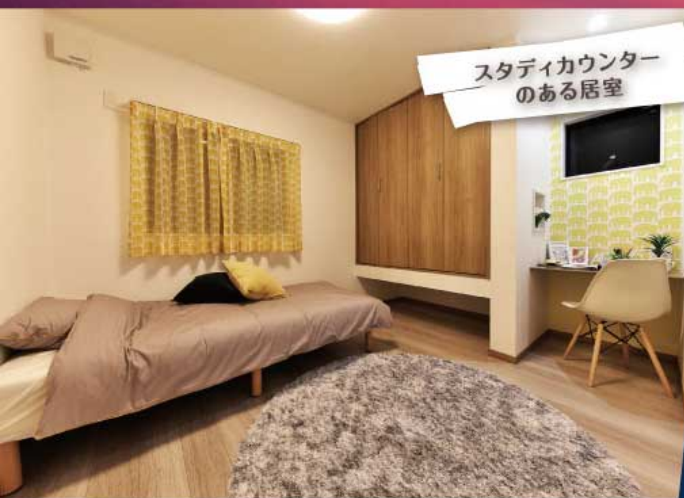
スタディカウンターのある居室