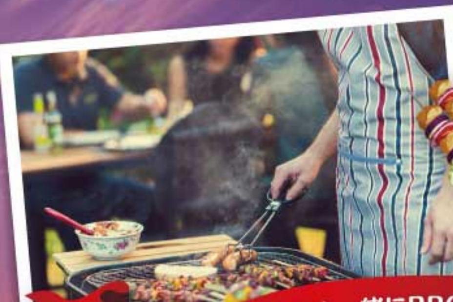
休日は家族やお友達と一緒にBBQ