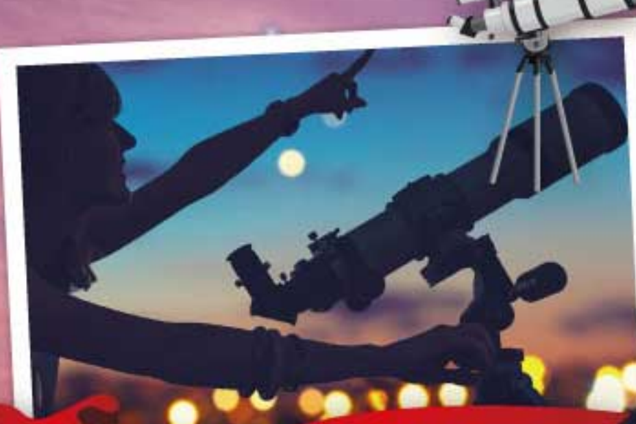
無電柱の広い夜空を天体観測!