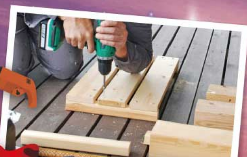
DIYで日曜大工を存分に満喫!