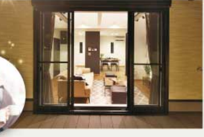
掲載の外観・内観写真は、現地モデルハウスにて撮影したものです。

リビングとつながるウッドデッキ は、便利なプライベート空間。様々な暮らしを満喫できます。