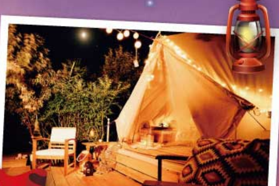
おうちでグランピング体験!