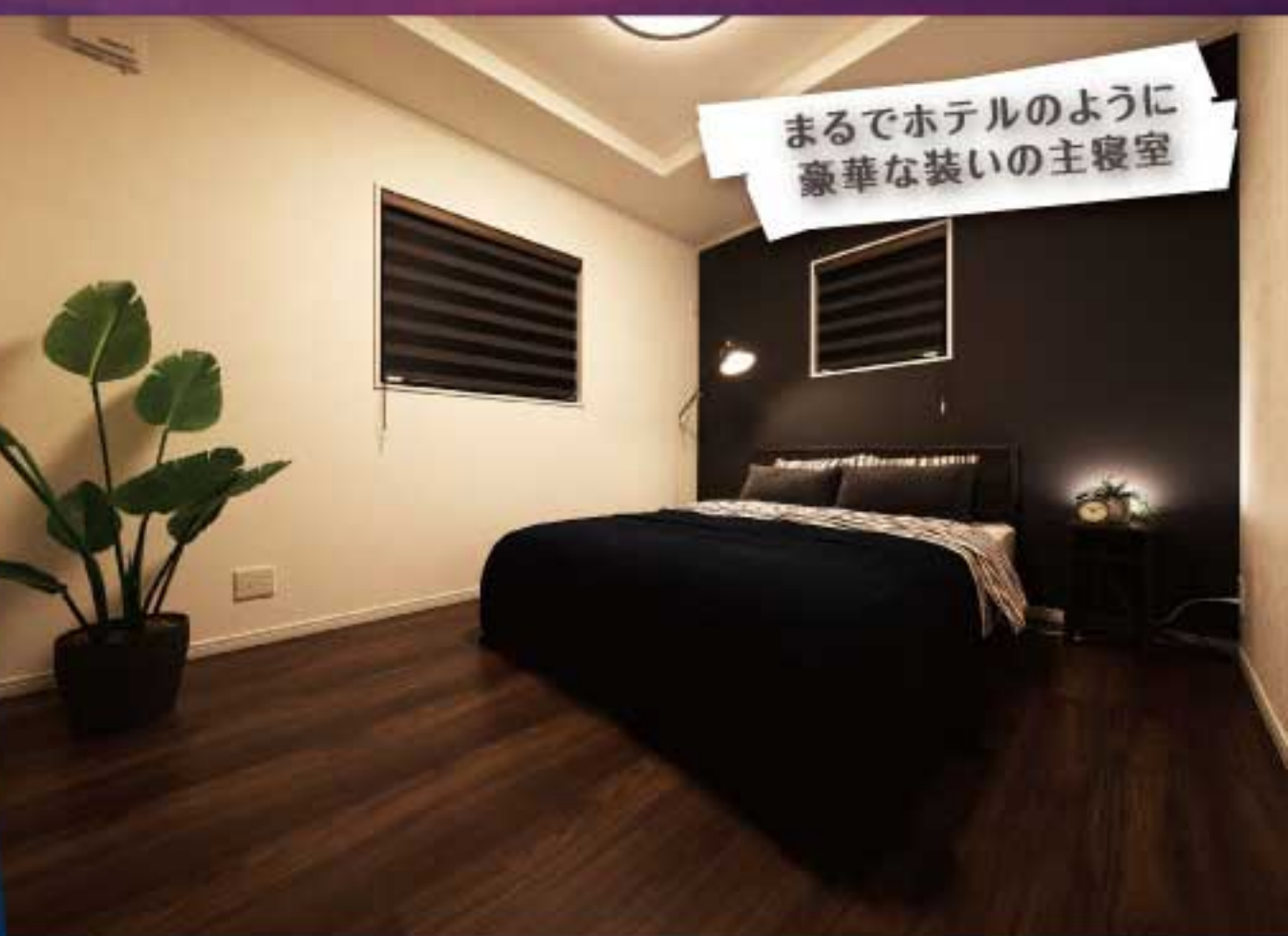
まるでホテルのように豪華な装いの主寝室