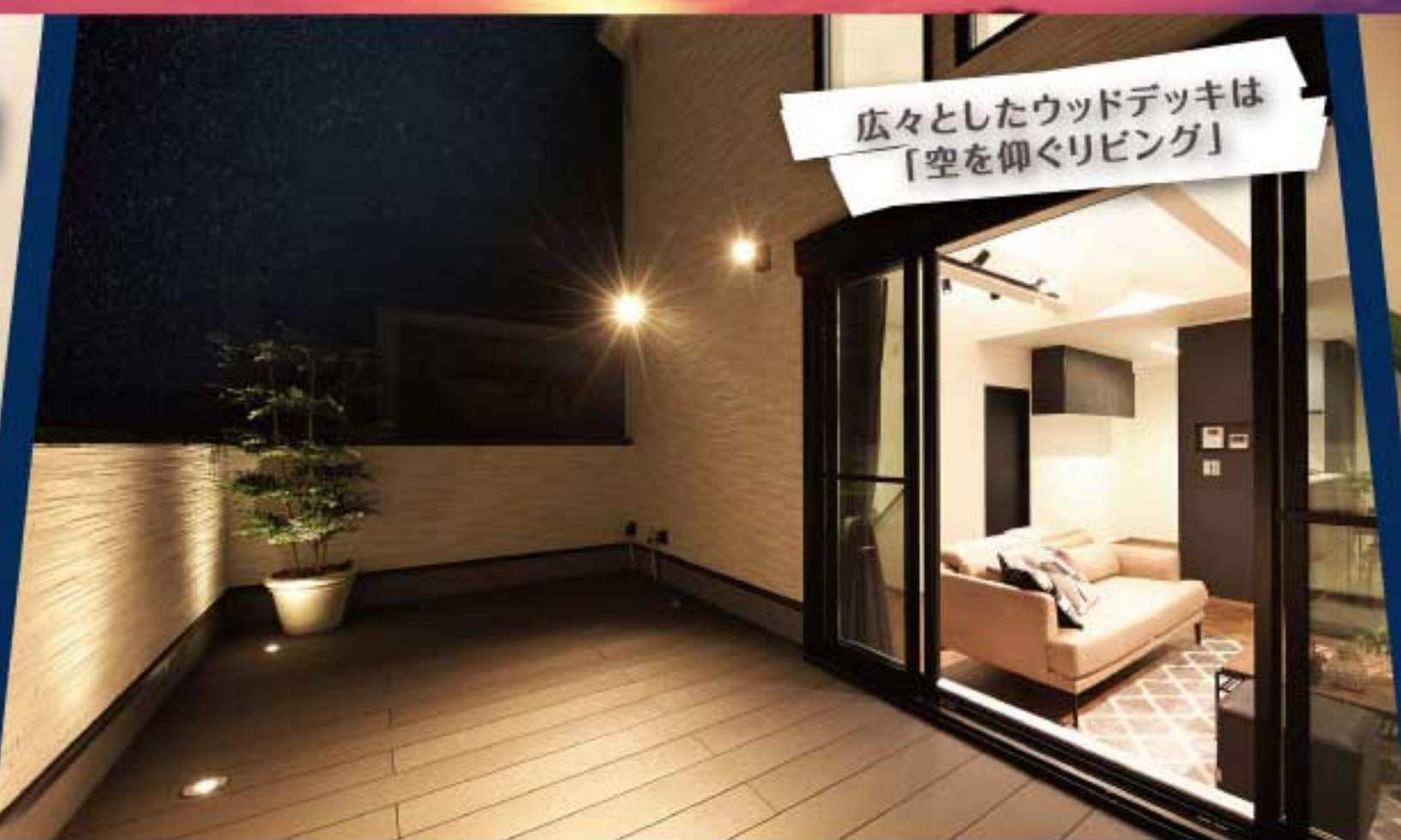
広々としたウッドデッキは「空を仰ぐリビング」